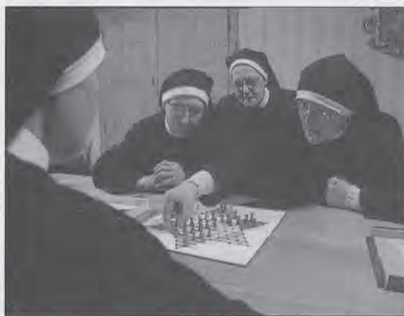
Nonnen des Klosters St. Johann in Müstair beim Halmaspielen.

Das Kloster St. Johann in Müstair wurde im 9. Jahrhundert von Karl dem Grossen gegründet. Wer ins Kloster eintritt und dem Orden treu bleibt, verlässt es bis zum Tod nie mehr. Umgekehrt haben Aussenstehende in den Klausurräumen nichts zu suchen. Seit 1983 ist das Kloster ein Weltkulturgut