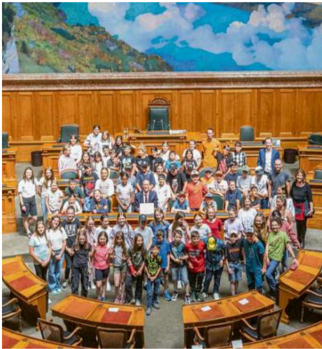
La finizun dal «Barat quadriling» ha gi lieu en Chasa federala.

Martin Candinas, il president dal Cussegl naziunal, ha retschavì las scolares ed ils scolars en la Chasa federala ed als ha dà in'invista en il manaschi politic da la Svizra plurilingua. Cun chanzuns en las quatter linguas naziunales han ils uffants laschè reviver las regurdientschas al champ a Mustér e festivà la finizun da l'emprim «Barat quadriling». Quel è vegnì organisà da la Lia Rumantscha sin iniziativa da Martin Candinas e cun sustegn da l'agentura naziunala Movetia. I sa tracta d'in concept per il barat linguistic e cultural che includa tut las quatter linguas naziunales. Il format duai cuntinuar ils proxims onns. (cdm/fmr)